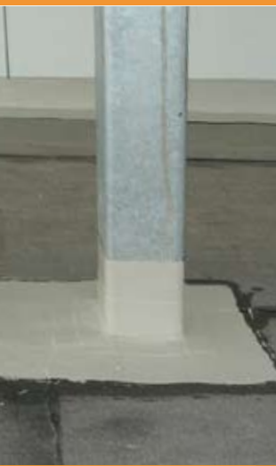
Anschlüsse an Stützen