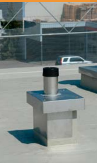
Anschlüsse an Entlüftungsaufbauten