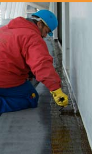
Einbau durch Verarbeiter am Dachrand